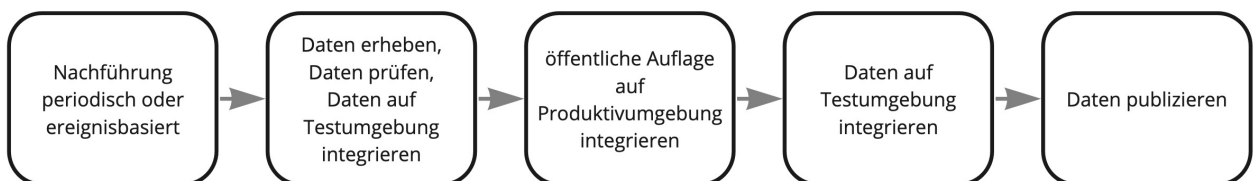
Abbildung 3. Gerelles Vorgehen beim Nachführungsprozess.

Eine Nachführung der Geodaten kann ereignisbezogen ausgelöst werden oder periodisch erfolgen. In beiden Fällen löst die zuständige Amtsstelle die Nachführung aus. Sie liefert der KVS den Änderungsdatensatz. Die KVS nimmt die Daten entgegen, registriert und prüft sie. Geprüft werden Datenkonsistenz und Modellkonformität. Wenn die Daten Fehler aufweisen, müssen sie durch die zuständige Stelle bereinigt werden.